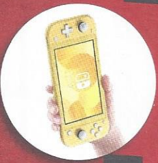
NINTENDO SWITCH LITE