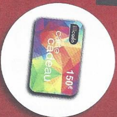
CARTE CADEAU 150€