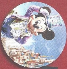
2 PLACES POUR DISNEYLAND PARIS